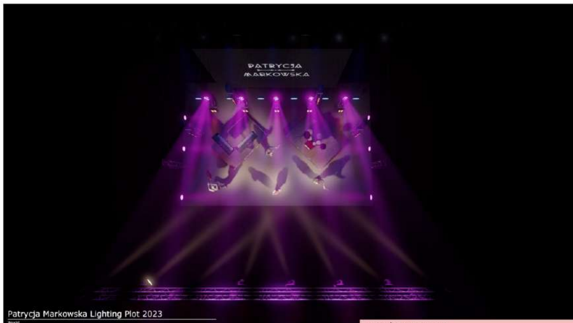
Patrycja Markowska Lighting Plot 2023