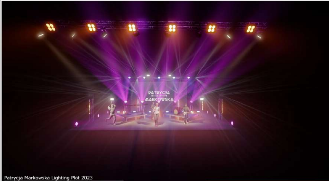
Patrycja Markowska Lighting Plot 2023

Drawing author: Marcin "Zarowa" Gościński